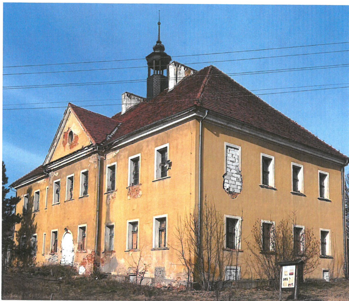
Pałac ul. Nowy Kisielin – Odrzańska 57