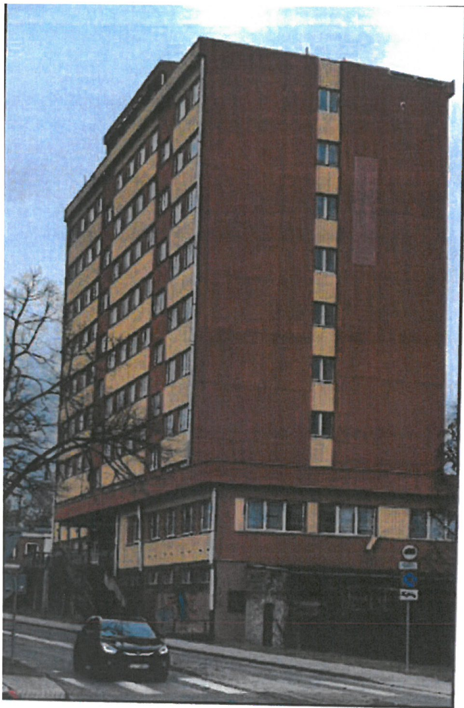
Budynek C-10 Dom Studenta ul. Ogrodowa 3b w Zielonej Górze

Załącznik do Informacji nr 2 – zdjęcia poglądowe obiektów