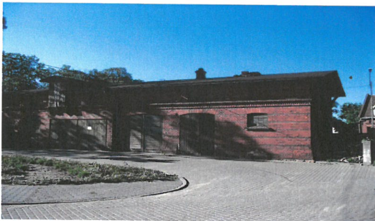
Budynek gospodarczy GS-21, Sulechów ul. Armii Krajowej 48