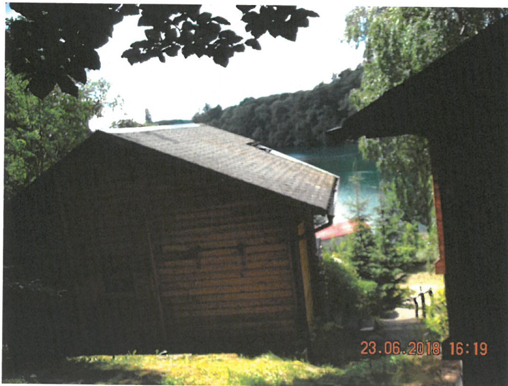
Ośrodek Szkoleniowo-Wypoczynkowy w Łagowie