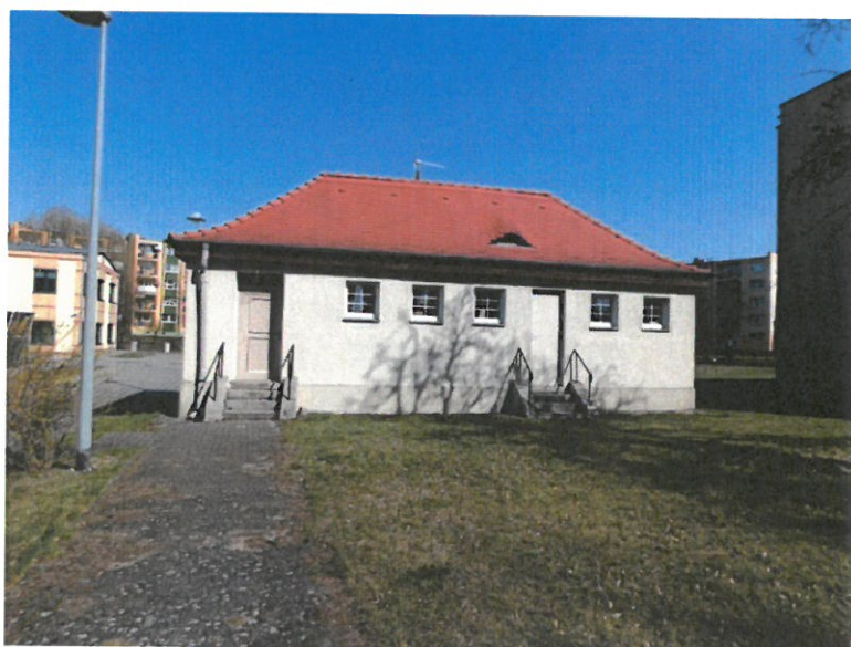
Budynek gospodarczy GS-22, Sulechów ul. Armii Krajowej 51