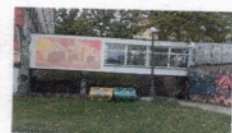
widok na DS 2 od strony ul. Szafrana